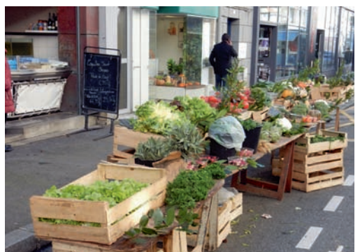
Le marché du mardi, rue Amiral Linois