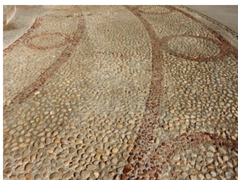
nosilW ecalp enqsoik ud ruotua