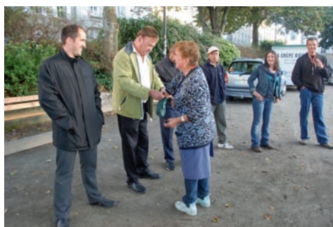
Tirage au sort à l'aide de boules

Pour ce qui est de la foire Saint-Michel dont le service pilote l'ensemble du dispositif, sa fréquentation a augmenté par rapport à 2017 avec 180 commerçants et 60 manèges.