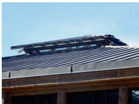
nitram-tnias sellah sed tioT

Tentez de retrouver les lieux photographiés (réponses sur cette page).