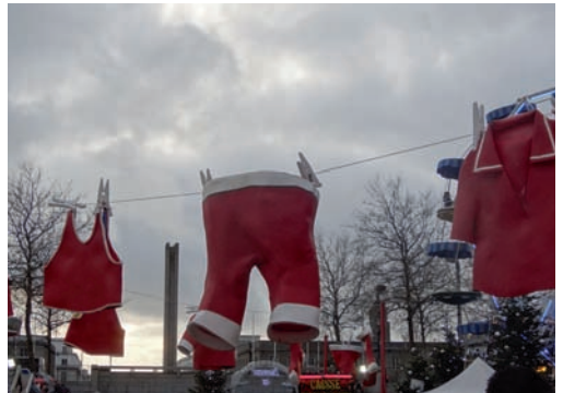
Le marché de Noël en 2017 et la corde à linge du Père Noël...