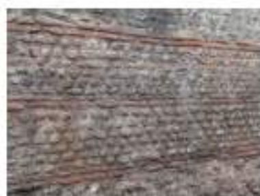
Vestiges romains au bas du château (accès musée de la Marine)