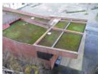
Toit de la Carène