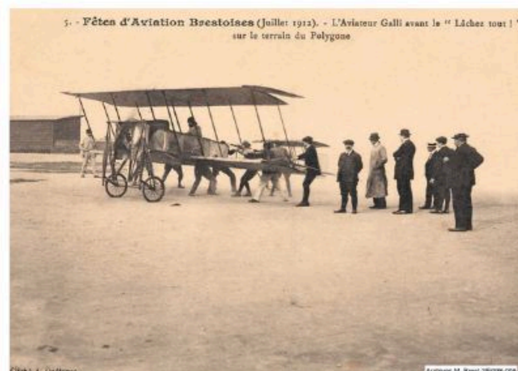
Ci-dessus : Meeting aérien au Polygone en 1912

En 1912, l'aventure hasardeuse des premiers pilotes passionne les foules qui, sur l'esplanade, assistent aux premiers meetings aériens. En 1914, l'aviateur Challe et son mécanicien réalisent la première liaison Paris-Brest (St-Pierre)-Paris. Le voyage fut émaillé d'incidents techniques nécessitant une grande escale à Rennes puis l'arrivée « chez nous » devant la « grande butte ». Exploit notable : 6h20 de vol total pour franchir la distance. Ce terrain parfaitement aplani accueillera régulièrement des courses hippiques à l'initiative de l'Amiral Gueydon - celui du petit pont - pour le plus grand plaisir des Brestois. On y crée un terrain de football avec piste d'athlétisme en 1921 et aussi une cité d'urgence de 1945 à 1976.