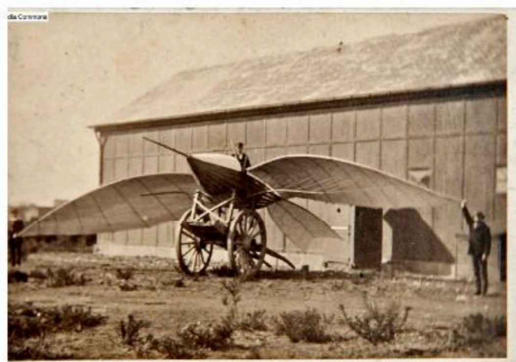
Ci-dessus : c.j. M. Le Bris dans son Albatros en 1868

L'explication est là : en 1861, sous Napoléon III, la Marine décide d'aménager à St-Pierre une zone destinée à tester l'artillerie. Sa municipalité s'oppose à ce projet qui subtilise 30 hectares de terre labourable, mais la raison d'État l'emporte. Le travail est colossal pour aplanir le site sur 200 mètres de large et 1,5 kilomètre de long.