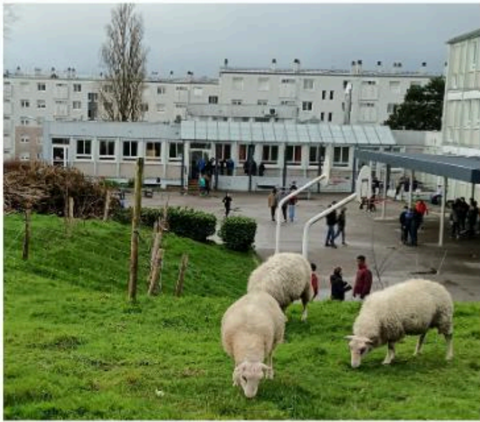
ci-dessus : Les moutons paissant lors d'une récréation

Rencontres insolites, en se promenant dans le bourg de Saint-Pierre, on peut voir des moutons blancs ou noirs, paissant tranquillement dans l'enceinte du collège Saint-Pol-Roux... Renseignements pris auprès des bergers, on les trouve aussi à L'Arc'hantel, au parc d'Éole, à la Salette. C'est une surprise et un plaisir des yeux, la campagne en ville ! Explication : la Ville a instauré un système d'écopâturage, aux effets bénéfiques confirmés dans d'autres régions. Il anime le quartier, apporte du lien social et entretient les espaces verts de manière on ne peut plus écologique. A Brest, la race rustique de moutons « Landes de Bretagne » leur permet de s'adapter aux conditions climatiques : leur laine très épaisse les protège de l'humidité et des vents forts. Les bergers veillent à leur bien-être, les déplacent de pâturage en pâturage. Ces brebis sont dociles et de bon caractère ! Les petits (un à deux par mère) naissent au printemps... Nous vous donnerons des nouvelles de ce petit cheptel dans le prochain « Ptit Kerber ».