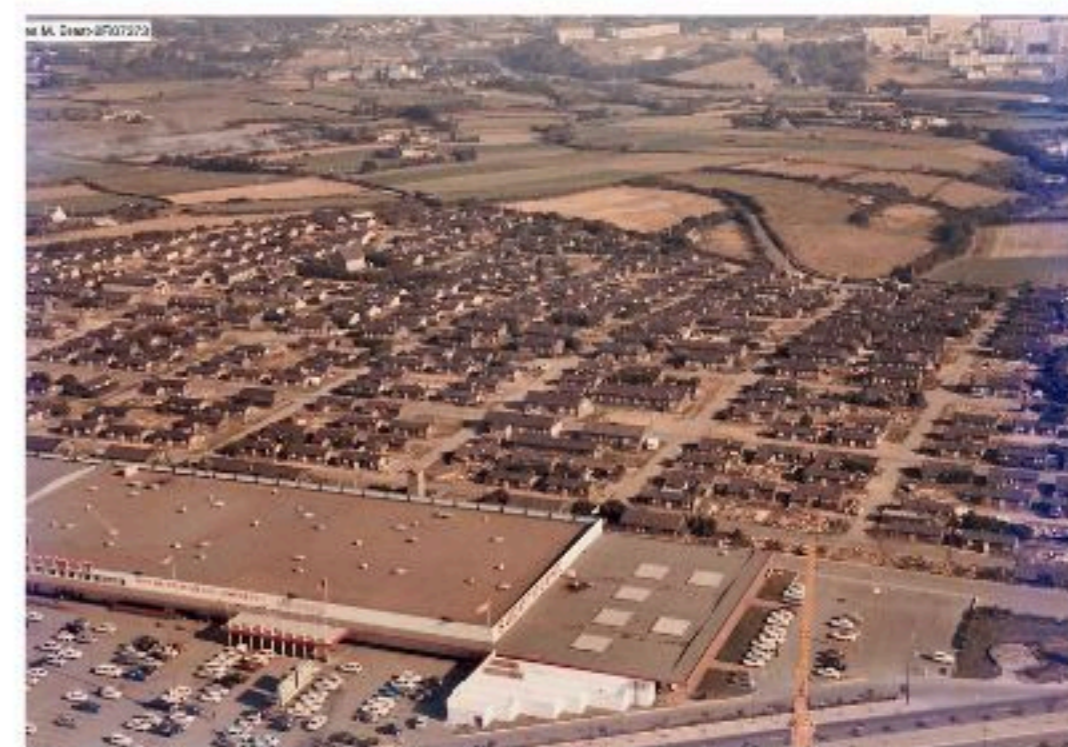
Ci-dessus : Superouest et les baraques en 1972, Archives municipales de Brest

Avec pelles, pioches, brouettes et tombereaux, il faut déplacer plus de 50 000 m 3 pour combler les points bas et édifier une grande butte à l'ouest et une seconde au centre, destinées à réceptionner les obus d'entraînement. En 1868, l'opportunité de disposer de cette plaine dégagée séduira l'aviation naissante. Les matelots du Borda y tirent à bout de bras une espèce d'oiseau ; ils procèdent à un essai d'envol de l'Albatros, nouveau prototype de Jean-Marie Le Bris (précurseur avec sa Barque Ailée) qui semble être parvenu à faire planer ce plus « lourd que l'air » avant une destruction de l'engin lors d'un atterrissage. Ce premier vol confirmera l'intérêt du site pour cette toute nouvelle technologie : l'aviation. Ceci fera du Polygone le premier aérodrome brestois.