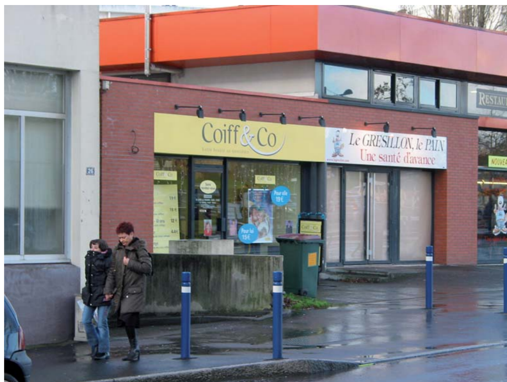
La pose de plots a permis de sécuriser le cheminement des piétons.

Après rencontre avec les techniciens certaines demandes ont pu être honorées rapidement, d'autre demandant une étude approfondie.