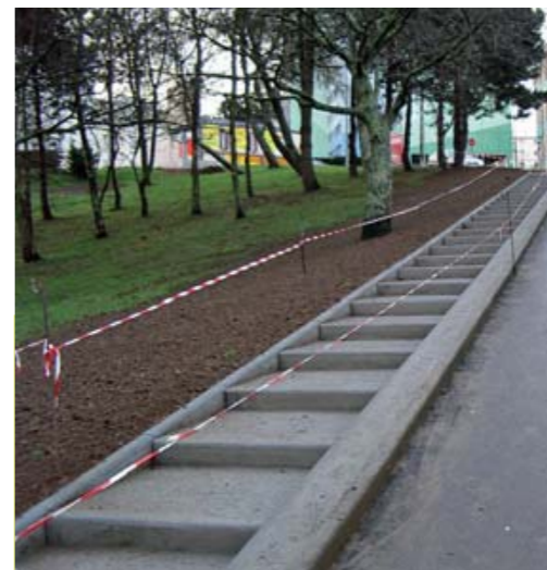
Travaux de voirie.

Sortie sympathique qui nous a tous permis de comprendre les points de vue des inspecteurs du domaine public, des élus, des services techniques,... Inutile de dire que les « y a qu'à », les « et pourquoi » ont fusé toute la matinée.