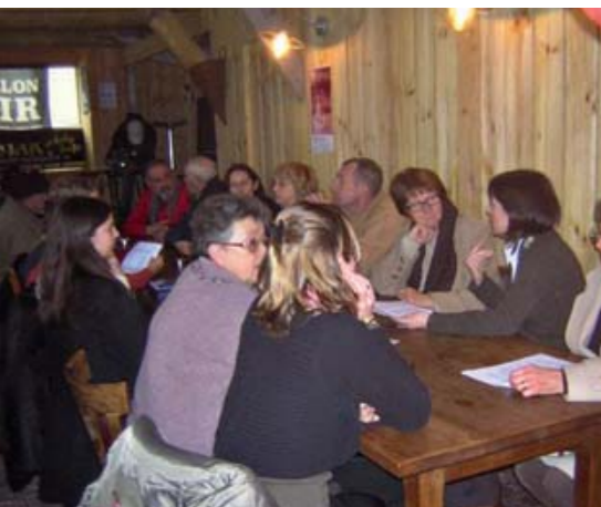
Le bistrot-mémoire, « Côté Mer » au Moulin-Blanc.