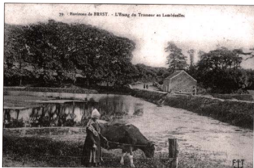
Lac du Tromeur au début des années 1900...