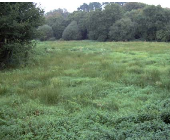
... et aujourd'hui.