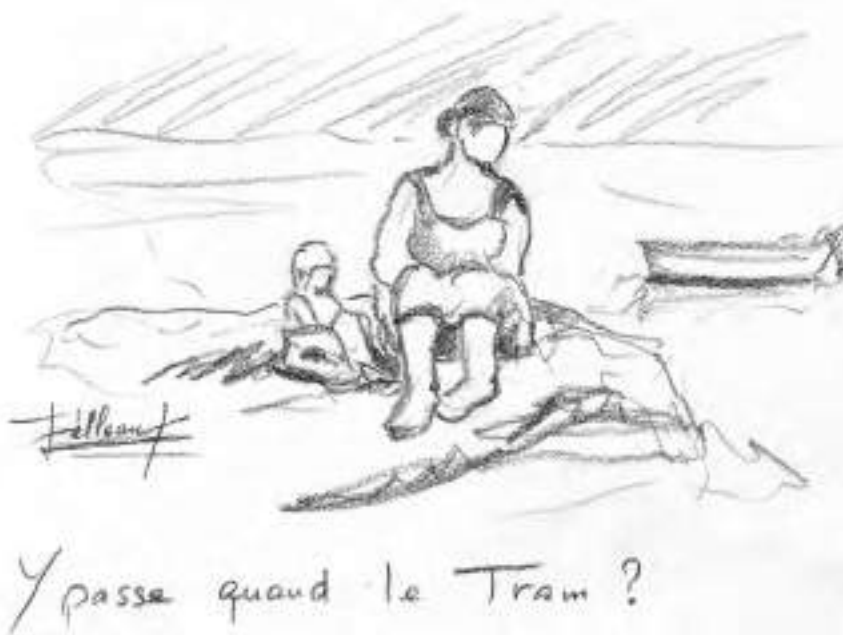
Dessin réalisé par Eric Pelleau -artiste-peintre brestoises (voir p. 6)