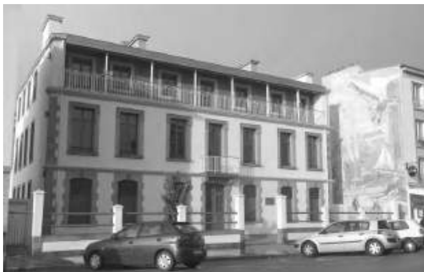
quai de la Douane