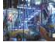
Carrousel de Noël, place de la Liberté