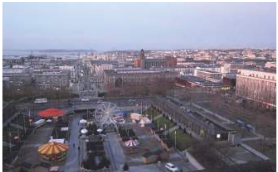
Vue du 8 ème étage de la mairie de Brest-Centre un matin ensoleillé d'hiver

Sur Brest Métropole Océane, le nombre de demandes HLM est d'environ 3000 par an et le délai moyen d'attente d'un logement de 6