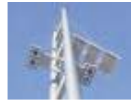
Nouvel éclairage bas de Siam