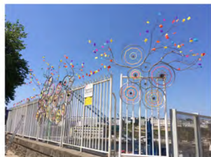
Une ligne de papillons pour annoncer les deux morceaux de l'œuvre