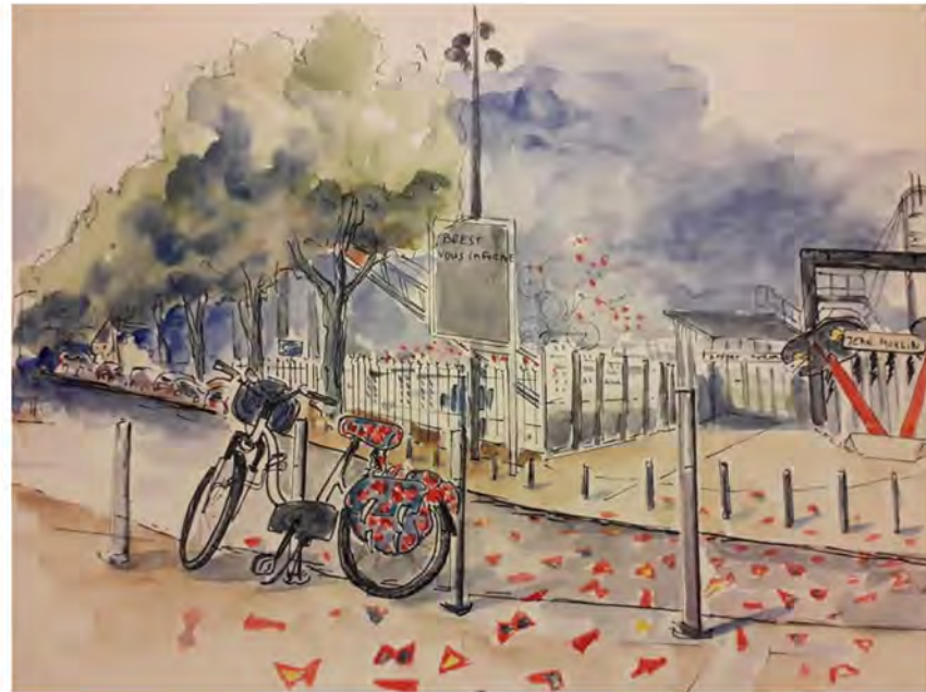
Vu sur la page Facebook des Urban sketchers : dessin de Monique Pommepuy, 16 juillet 2018