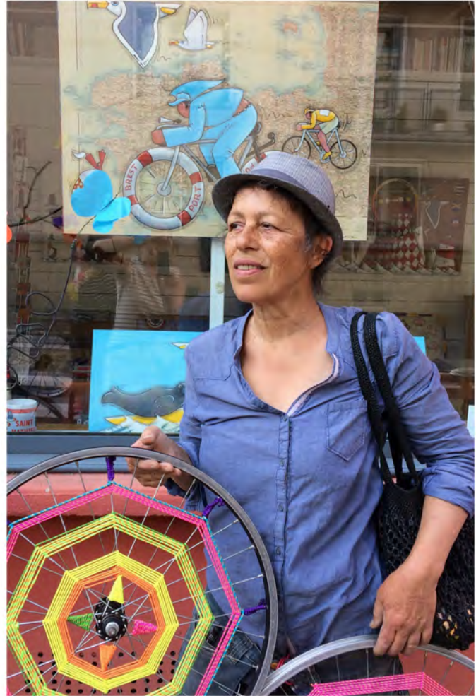
. 10 juillet : photos prises pendant le transport de la structure à pied, avec arrêt devant l'atelier Ramine 21