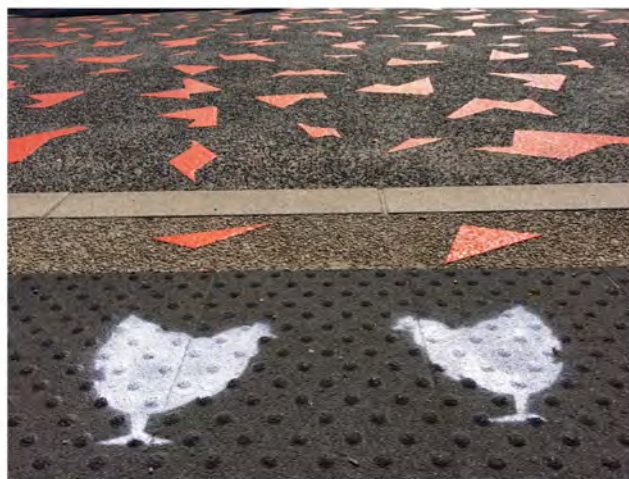
Installation sous l'œil attentif du maire de Brest-centre, accompagnée de la fanfare Pétarade et des poules !