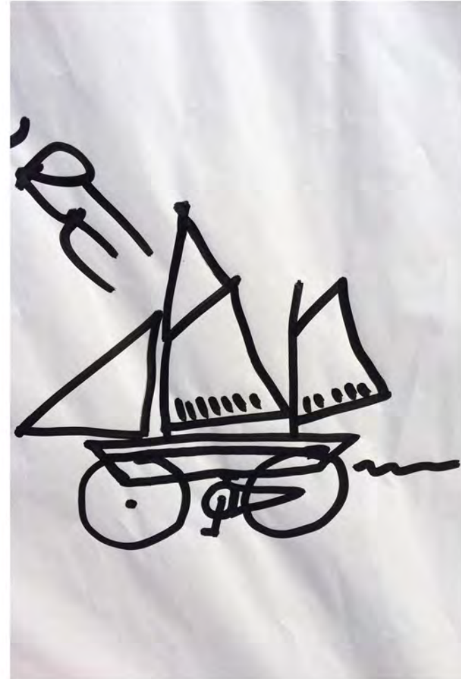
Communiqué de presse et dessin « glané »

T Davantage sur letel et sur l'a Bouger o