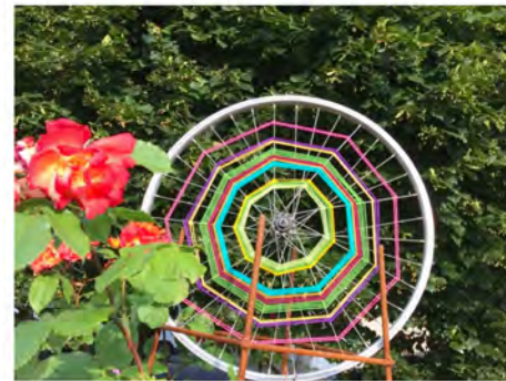
Mise en scène sur le Rond de Jardin pour publicité sur Facebook du stand du 1er juillet au marché 5