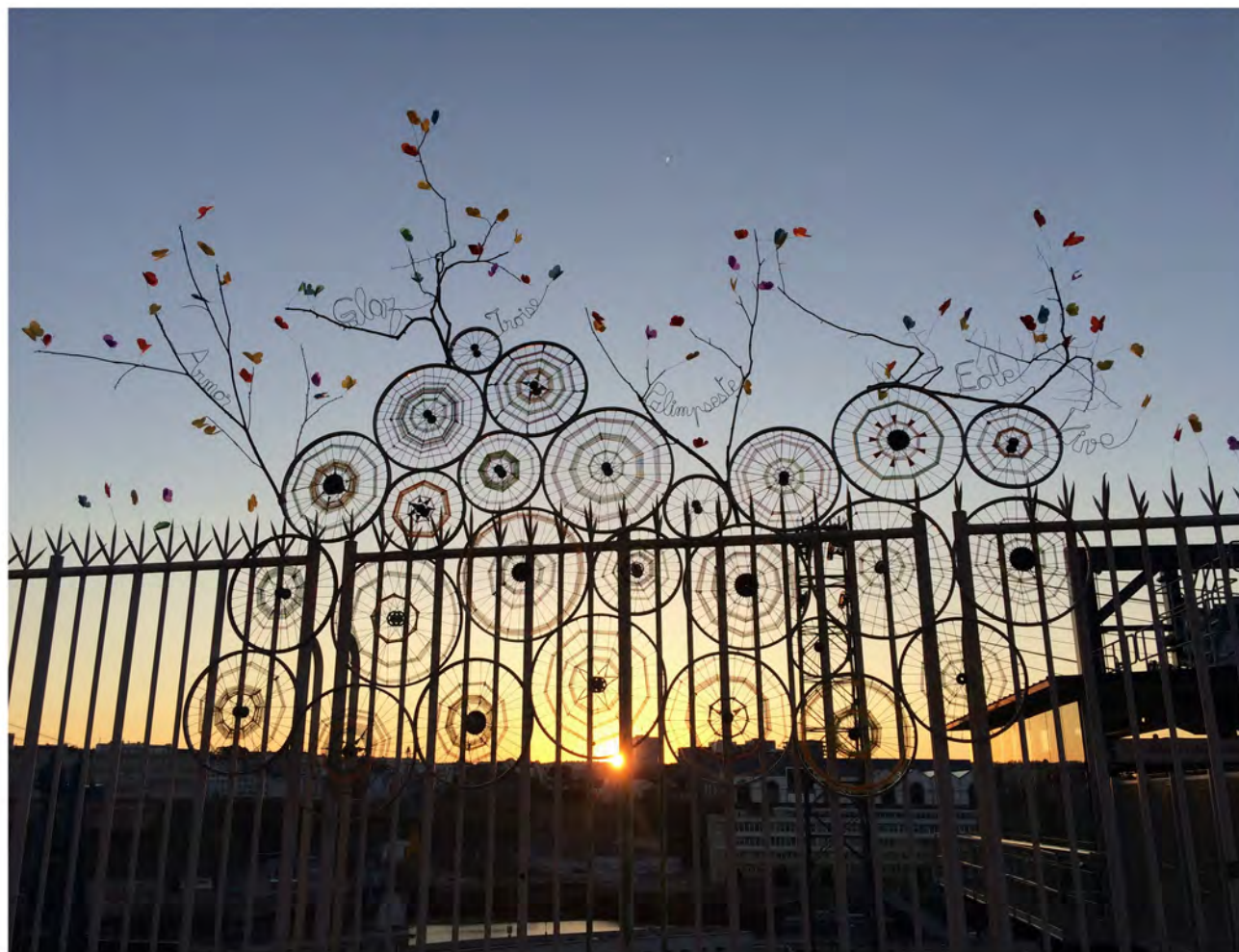
Coucher de soleil sur l'œuvre « cyclopoétique » 27