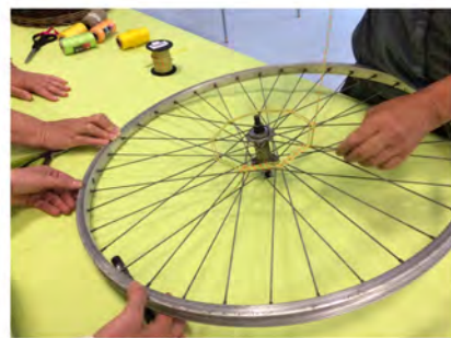
Le tissage nécessite de la concentration, tout comme le découpage de papillon