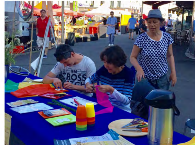
6 1er juillet : stand au marché devant les halles Saint Louis pour la fabrication de papillons et la collecte de mots en rapport avec Brest